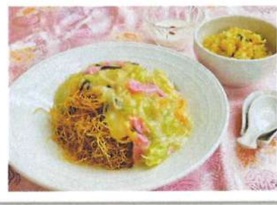
「血うどん」+ミニチャーハン Nagasaki Chanpon Noodles With Various Topping